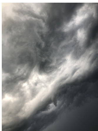
En portada Tormenta. Tlayacapan, Morelos. Julio de 2017.