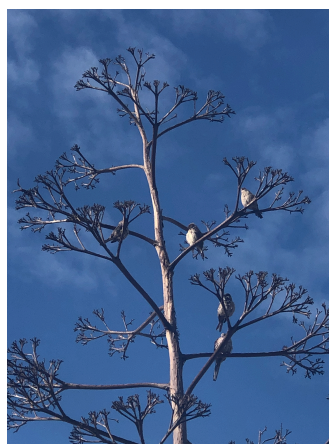
En contraportada Amanecer Chabacano, CDMX.