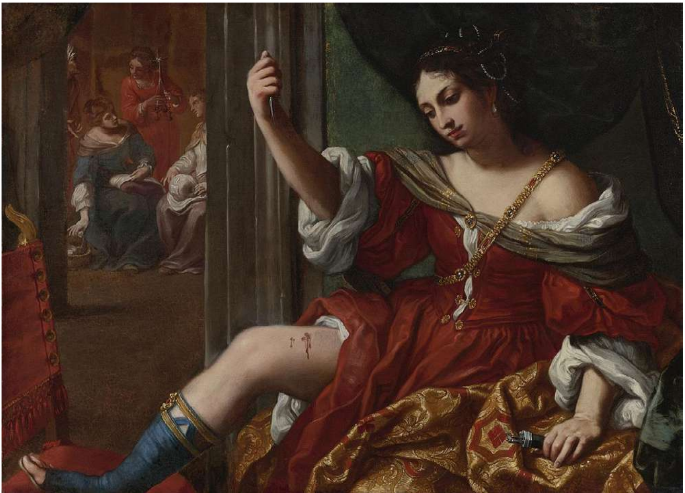
Porzia si ferisce alla gamba, Elisabetta Sirani

Por otro lado, en otra de sus obras, Porzia hiriéndose en el muslo , Sirani representa la escena en la que la hija de Catón y esposa de Bruto, uno de los asesinos