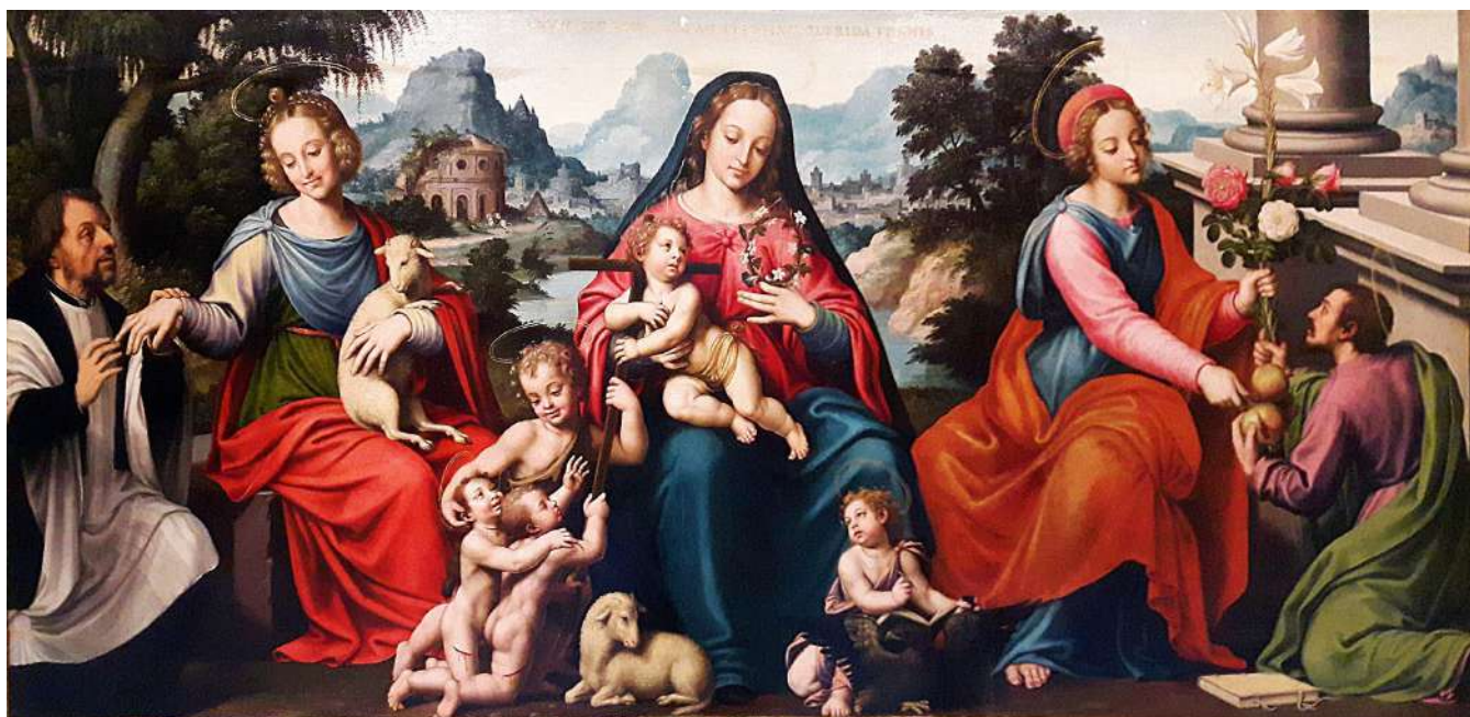
Las bodas místicas del Venerable Agnesio de Juan de Juanes

Durante la Edad Media se desarrolló entre los gremios una actitud antifemenina, toda mujer que no tuviera marido, que hubiera abortado, que se dedicara a la medicina de herbolaria, que supiera leer o tuviera alguna