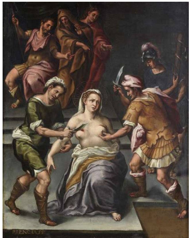
El martirio de Santa Águeda. Gaspar de Palencia

Comencemos con Elisabetta Sirani nacida en Bolonia, 1638 y fallecida en Bolonia, 1665. “Es totalmente