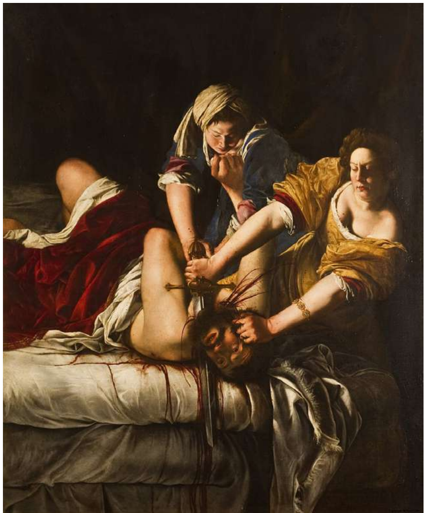
Judith decapitando a Holofernes, Artemisia Gentileschi

De esta forma, nos hemos dado cuenta de que, aunque el concepto de feminismo no existía en el momento, ellas pusieron los cimientos y que, en la actualidad de nuestras vidas, son íconos de la lucha, de la venganza y del empoderamiento de la mujer del siglo XXI; como lo es Artemisia Gentileschi, con un libro dedicado a ella Artemisia, Anna Banti (1947); su nombre resurgió del olvido y en abril de 2020, la National Gallery de Londres, presentó una exposición en su honor. Poner en alto sus nombres y recordarlas son una forma de deconstruir la sociedad machista en las artes y en la sociedad de la actualidad.