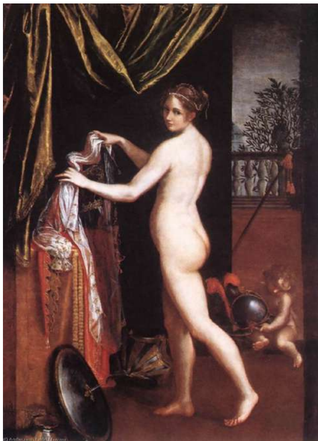
Minerva en el vestidor, Lavinia Fontana