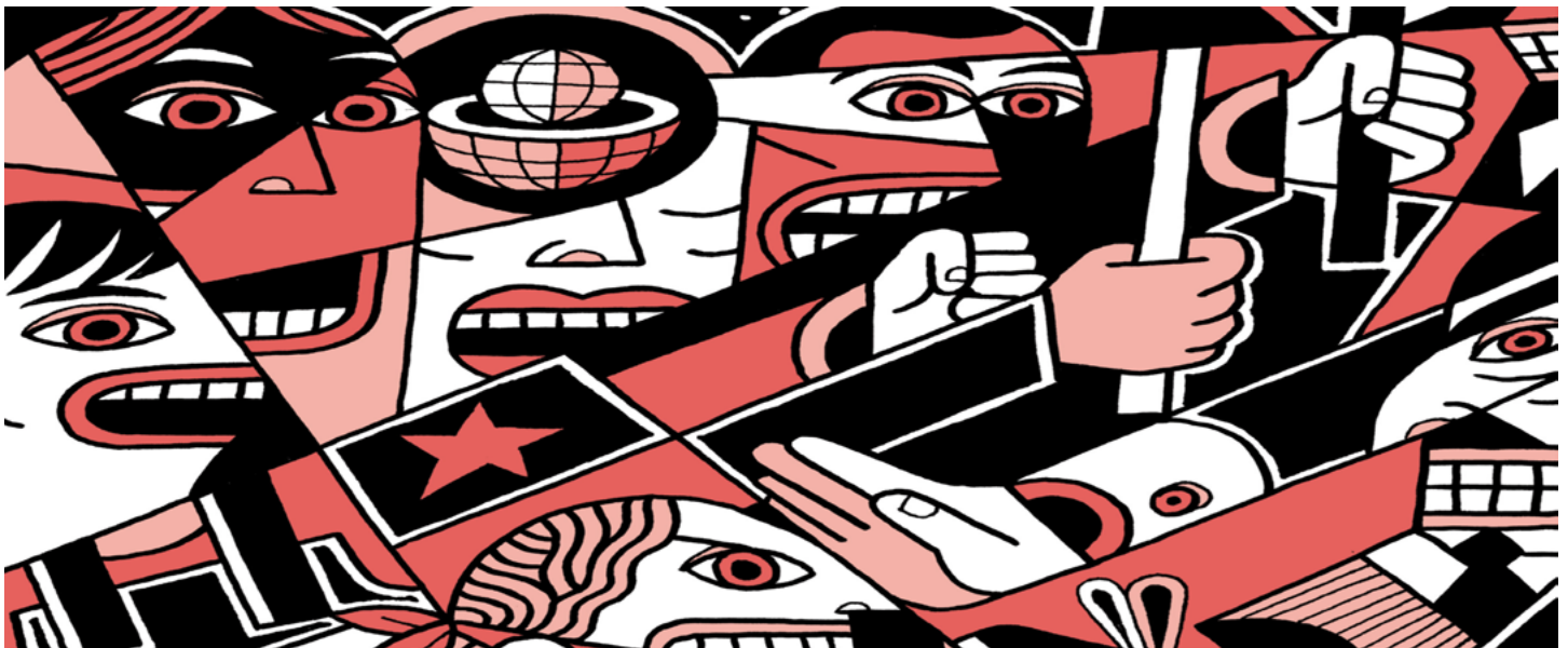
Fotografía: Elías Taño (2021/06/01)

Para responder a esta controversial pregunta, antes hay que señalar que en el ámbito filosófico y político la libertad absoluta es postulada por diferentes pensadores. Su marco teórico implica considerar nociones fundamentales sobre la autonomía individual, la ausencia de restricciones externas y la capacidad de actuar sin limitaciones. La inexistencia de contextos externos implica la falta de reglas sociales de convivencia, el vacío de leyes que organicen la sociedad en sus relaciones sociales y las instituciones que vigilen su cumplimiento para garantizar las relaciones sociales. Una situación con estas características impulsa el logro de objetivos particulares por medio de mecanismos que solo invo-